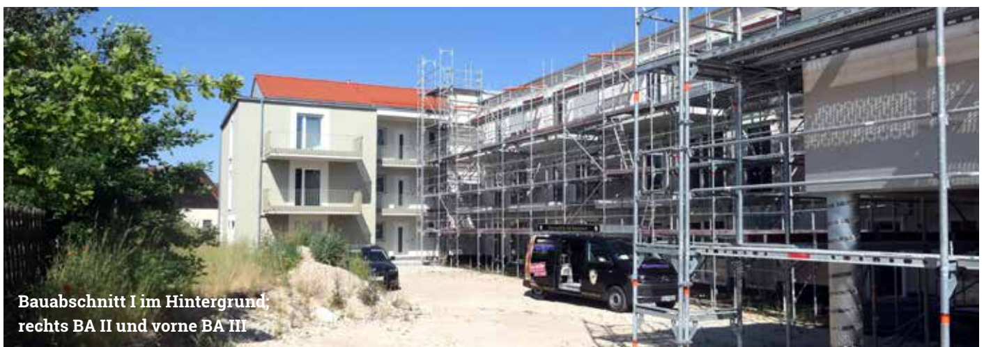
Bauabschnitt I im Hintergrund, rechts BA II und vorne BA III