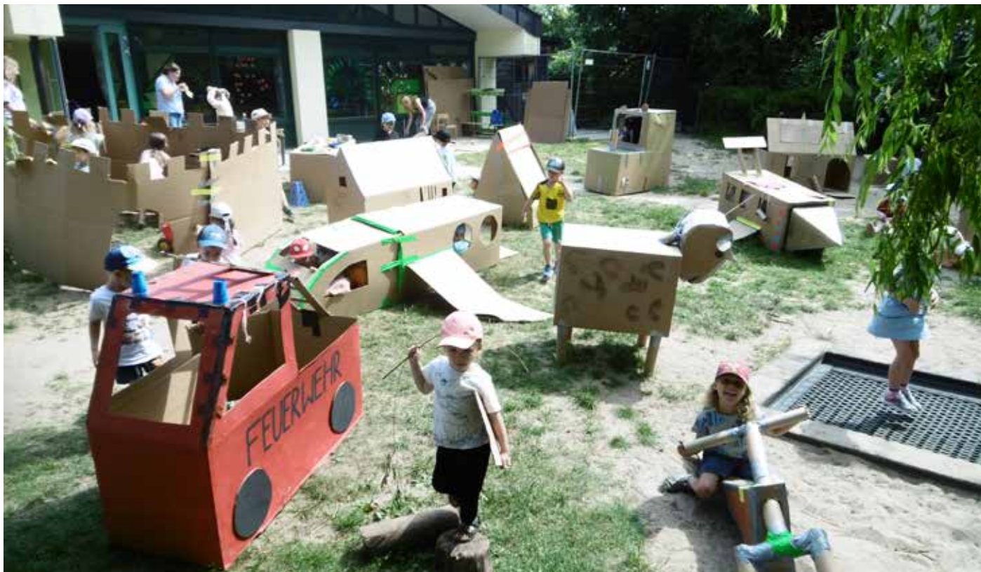
„Stadt im Garten“ im HAUS für KINDER