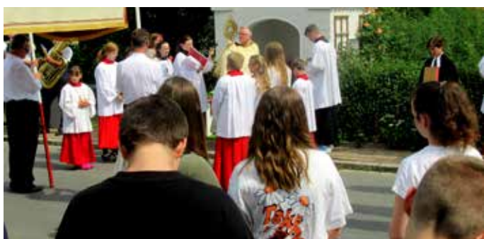
Begegnungen an Fronleichnam 2023