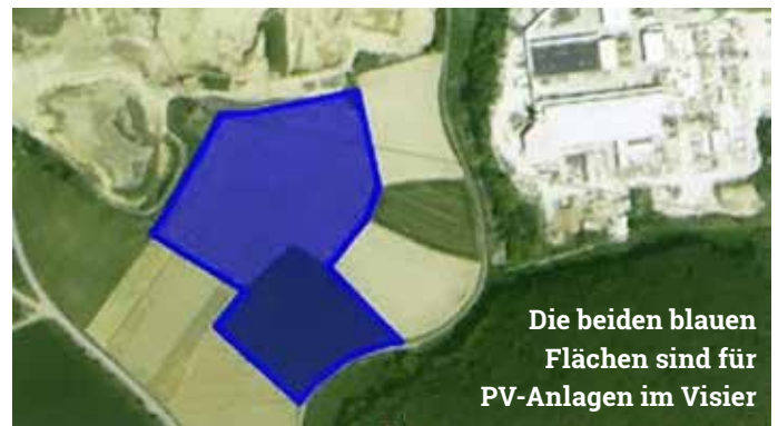
Die beiden blauen Flächen sind für PV-Anlagen im Visier

Spalter Straße. Bei der Erstellung des Kriterienkatalogs Photovoltaik (wir berichteten darüber) ließ sich die Gemeinde davon leiten, dass eine Nutzung von Flächen für PV-Anlagen in weitgehend unberührter Natur nicht erstrebt sei. Bei den beiden Flächen, für die der Eigentümer (Betonwerk Fuchs) jetzt einen Antrag auf Eintrag in den Kriterienkatalog gestellt hat, handelt es sich so gesehen nicht um ein schützenswertes Areal.