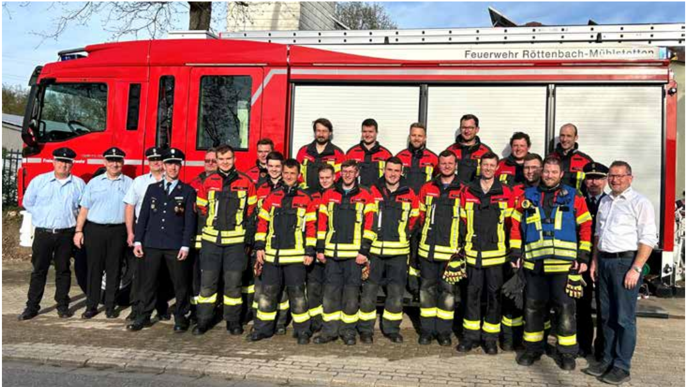
Am 12.04 konnte die Freiwillige Feuerwehr Röttenbach Mühlstetten mit zwei Gruppen, also 18 Personen die Leistungsprüfung erfolgreich absolvieren.