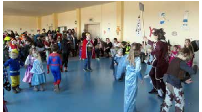
Unten: Impressionen vom TSV-Kinderfasching