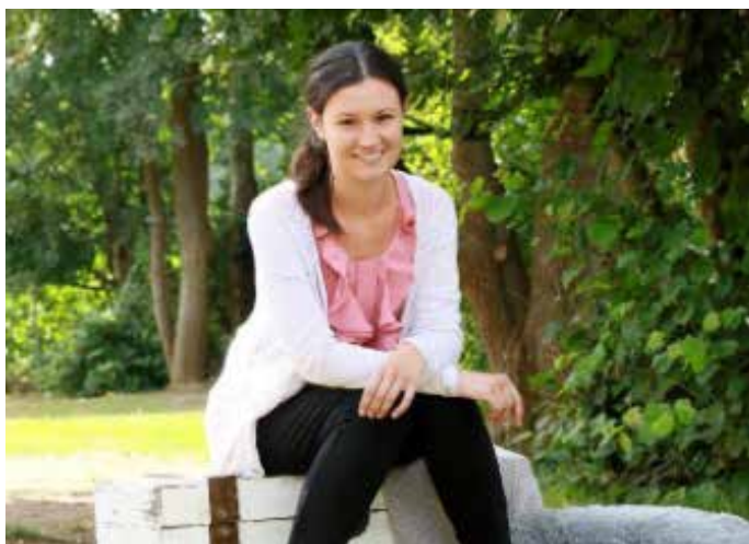
Ihr Team vom HAUS für KINDER

Seit dem 03.04.2023 arbeite ich als Integrativkraft bei den Schnecken und Libellen und ich freue mich darauf, die Kinder in ihrem Alltag ein Stück begleiten zu dürfen, sowie auf eine gute Zusammenarbeit mit dem Team und Eltern.