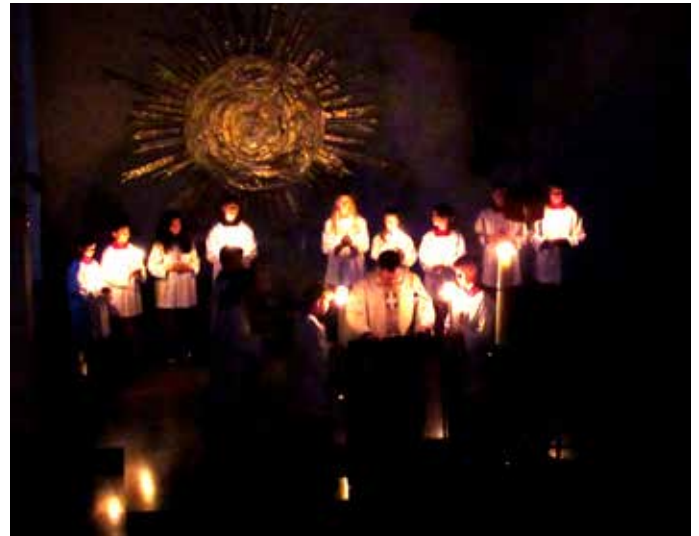
Abends noch in der gemeinsamen Agape eine besonders gesellige Note fand. Text und Bild: Alois Osiander

So wurde die Auferstehungsfeier für Klein und Groß zu einem freudigen Erlebnis, das im weiteren Verlauf des