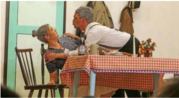
Der „Kohlrabiapostel“ auf Abwegen: in Tante Elisabeth wittert er eine gute Partie.

Es war beeindruckend, wie generationenübergreifend das Stück bei den Zuschauern ankam: die Dorfjugend war vom „Kohlrabiapostel“ und vor allem von dem Spiel der sechs Schauspieler und Schauspielerinnen in gleicher Weise angetan wie das reifere Publikum, so dass am Ende alle zufrieden und offensichtlich erheitert den Nachhauseweg antraten.