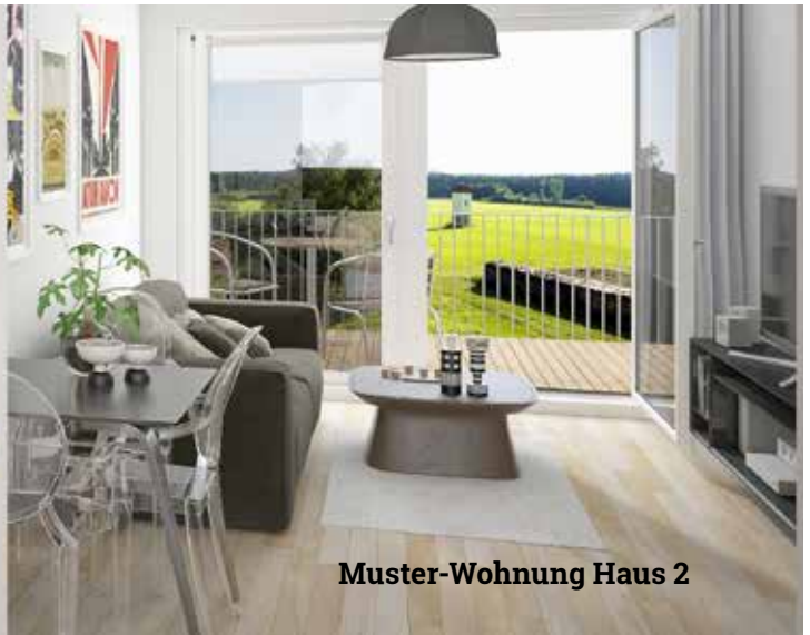
Muster-Wohnung Haus 2

ca. 20m 2 groß und verfügen über ein eigenes Bad. Jeder Bewohner kann seine Gäste im eigenen Zimmer empfangen. Es besteht eine 24-Stundenbetreuung, die auch für Menschen mit Demenz möglich ist. Dabei gehen wir davon aus, dass die Kosten deutlich unter denen eines stationären Pflegeheims liegen werden, obwohl die Leistungen vergleichbar, der Service individueller und die Beteiligung der Bewohner größer ist als im klassischen Pflegeheim. Das liegt vor allem an anderen gesetzlichen Rahmenbedingungen. Die Außenanlagen teilen sich die Bewohner aller drei Bauabschnitte. So soll ein familiäres