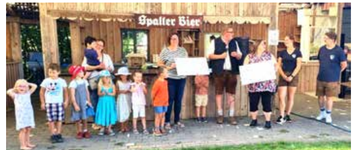
Übergabe des Spendenschecks durch die Landjugend

Ihr Team aus dem Kindergarten St. Martin