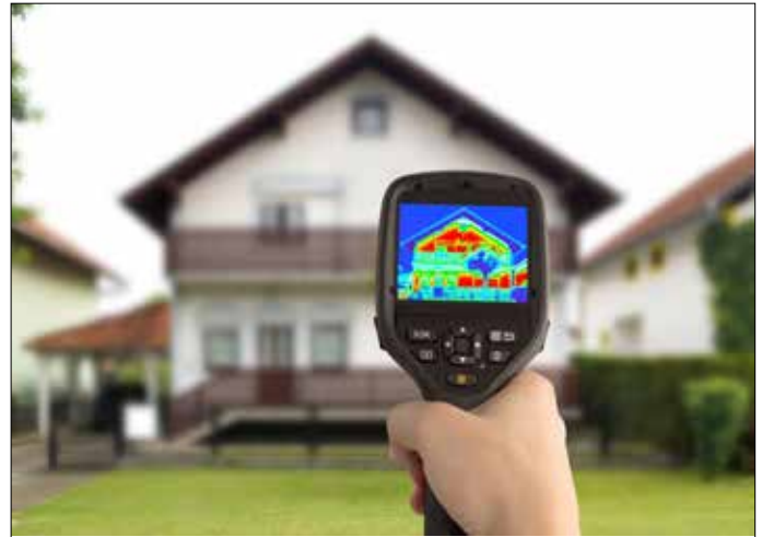
Die Wärmebildkamera deckt auf wie „bunt“ Ihr Haus wirklich ist und wo sich Wärme-/Kältebrücken befinden

Nutzen Sie die Gelegenheit, die Ihnen die Gemeinde Röttenbach bietet, um den Energieverlusten Ihres Hauses auf die Spur zu kommen!